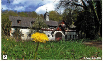
2 Gebäude der ehemaligen Filmunion in der Calmuth