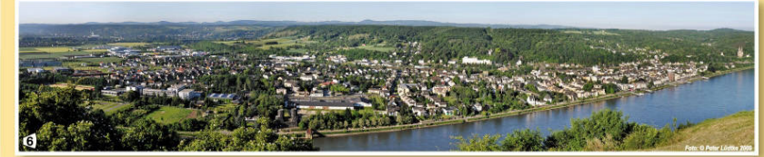
6 Blick von der Erpeler Ley auf Remagen, die Goldene Meile (links) und den Reissberg