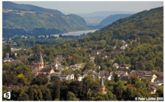
5 Blick auf Sinzig und die Andernacher Pforte