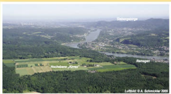
Blick von Süden über Kirres auf das Rheintal bis Bonn