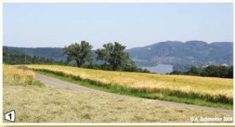
1 Blick auf das Siebengebirge mit Drachenfels