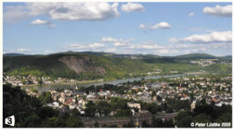
3 Blick auf Remagen und die Erpeler Ley