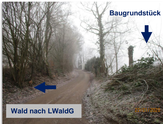
Abb. 3: Forstweg und angrenzender Gehölzstreifen / Wald nach LWaldG

Das Baugebiet des Änderungsbereiches grenzt an einen Forst-/Wirtschaftsweg an. Erst südöstlich dieses Wirtschaftsweges stockt ein schmaler Streifen von in der Regel niedrigstämmigen Waldgehölzen (Haselnuss, Birke, Hainbuche etc.) an, s. folgende Abbildung. Hieran schließt sich wiederum eine Lichtung an.